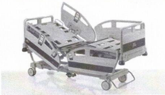
(Zdjęcie poglądowe oferowanego łóżka)